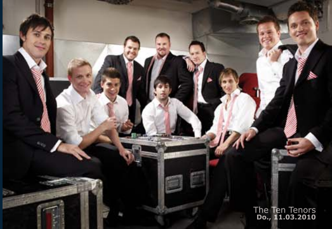
The Ten Tenors Do., 11.03.2010

DEUTSCHES HAUS Veranstaltungszentrum Flensburg